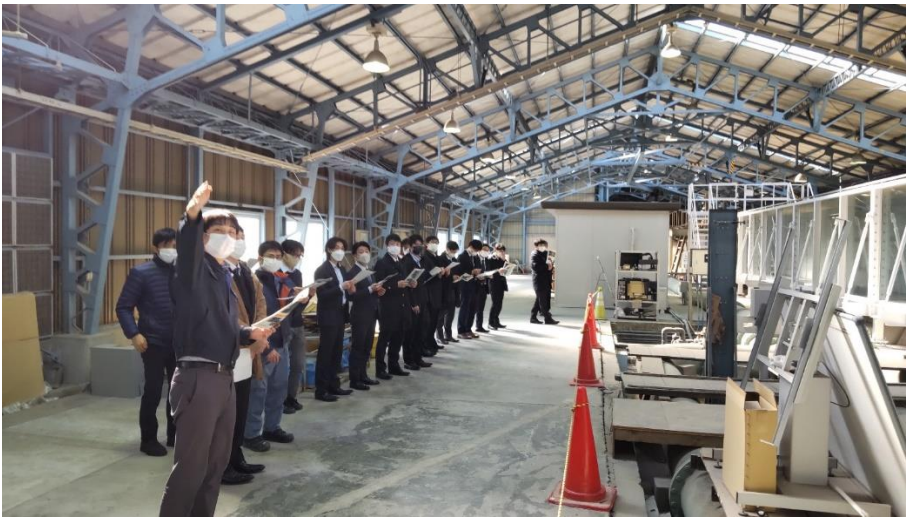
研究施設見学（台風防災実験施設）