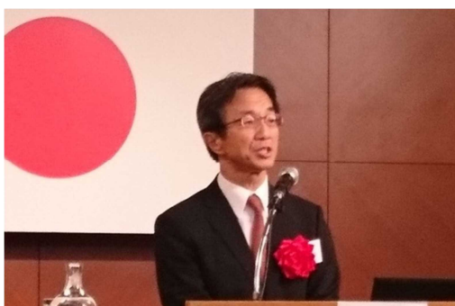
来賓挨拶（港空研・栗山所長）