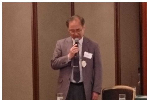
秋園事務局長説明